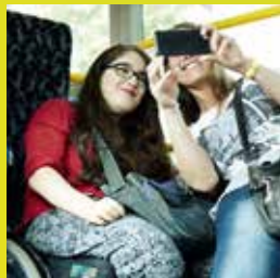
Die Freizeit selbst gestalten – unsere Betreuung macht es möglich.